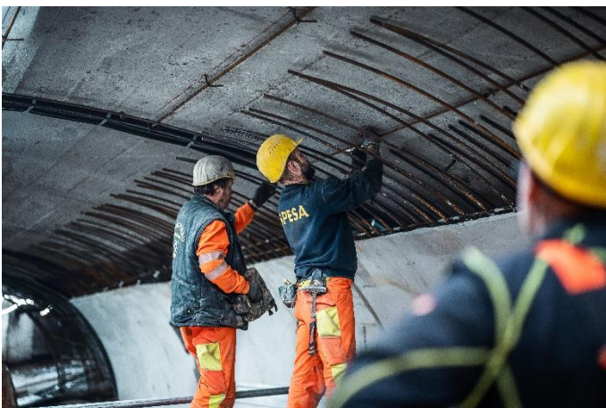
(3) 650 m 3 Ortbeton, 1.000 t Spritzbeton und 120 t Bewehrung kommen zum Einsatz.