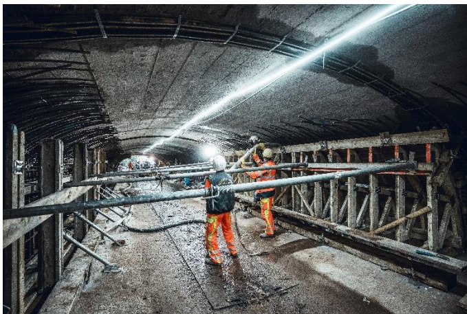
(1) Die Sanierung des 160 m langen Tunnelbauwerks der Holzrinde findet unter beengten Platzverhältnissen statt.